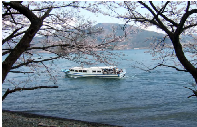
海津大崎の桜を湖の上から鑑賞するコース組 ↑ 大浦公園の桜並木を歩いて楽しむコース組 ↓