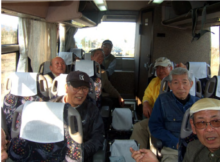
合計34名の参加者を乗せて...

大阪く観光バス～ヤンマー永原工場→近江大浦公園→桜並木遊歩道散策→海津大崎入り口・(観光組と合流)～大阪・梅田 総歩行距離: 約 10 km