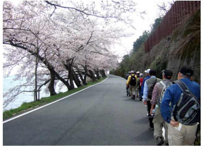
快適な桜見の散策でした